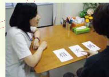
言語聴覚療法の様子