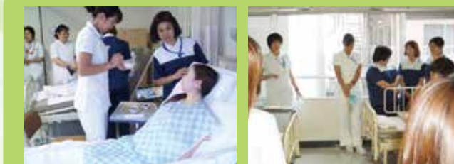
【院内実践研修の様子】